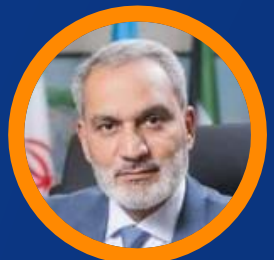
Haitham al-Ghais Secretário Geral da OPEC