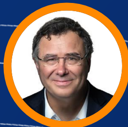
Patrick Pouyanné CEO TotalEnergies