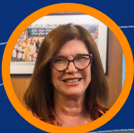
Magda Chambriard Presidente Petrobras