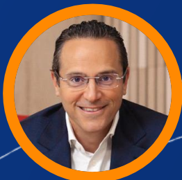
Wael Sawan CEO Shell